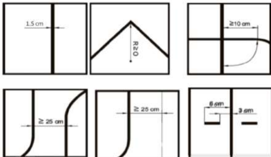
Примеры элементов полигона

4.5. Минимальный угол излома трассы 90°.